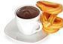
Chocolate con churros