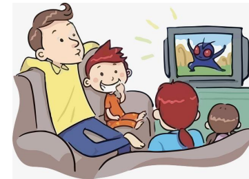
ver la televisión