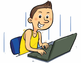
navegar en internet