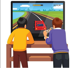
jugar a videojuegos